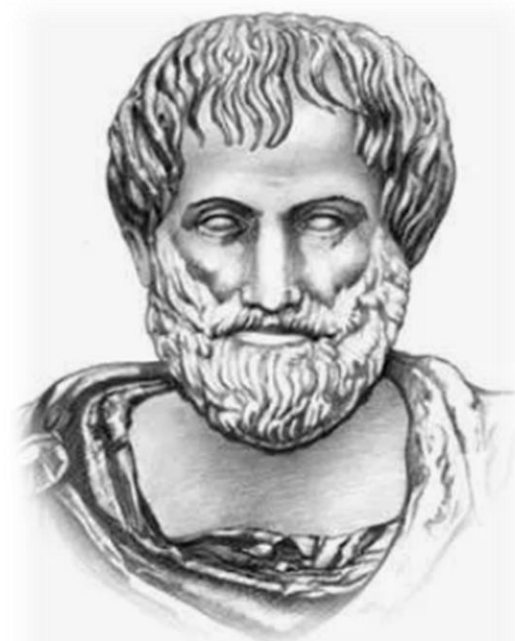
АРИСТОТЕЛЬ 384-322 до н. э.