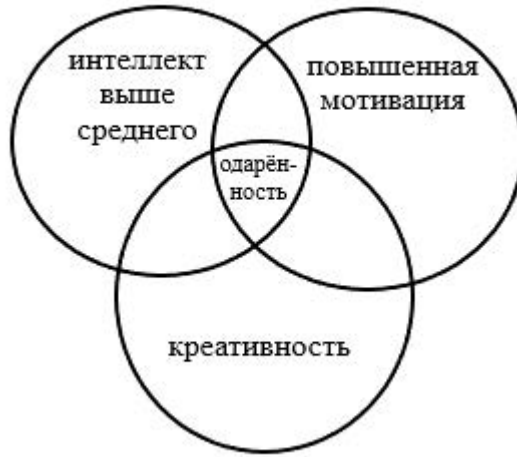
Рис. 1. Модель одаренности по Дж. Рензулли

Ф. Ж. Монкс [376] предложил многофакторную модель одаренности (рис. 2). Параметры, которые он предоставляет, немного отличаются от компонентов других моделей: традиционная мотивация, креативность и выдающиеся (экстраординарные) способности. Его интерпретация понятия мотивации такая же, как и у других исследователей (мотивация связана с ориентацией на задачу). Понятие «выдающиеся способности» включает, в частности, интеллектуальные характеристики. По сути, эта модель является модифицированной и улучшенной версией концепции Дж. Рензулли.