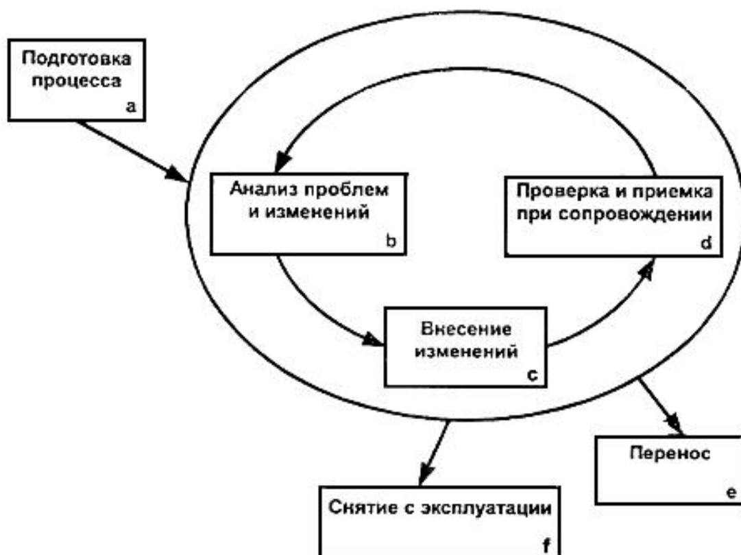
Рисунок 2 - Процесс сопровождения