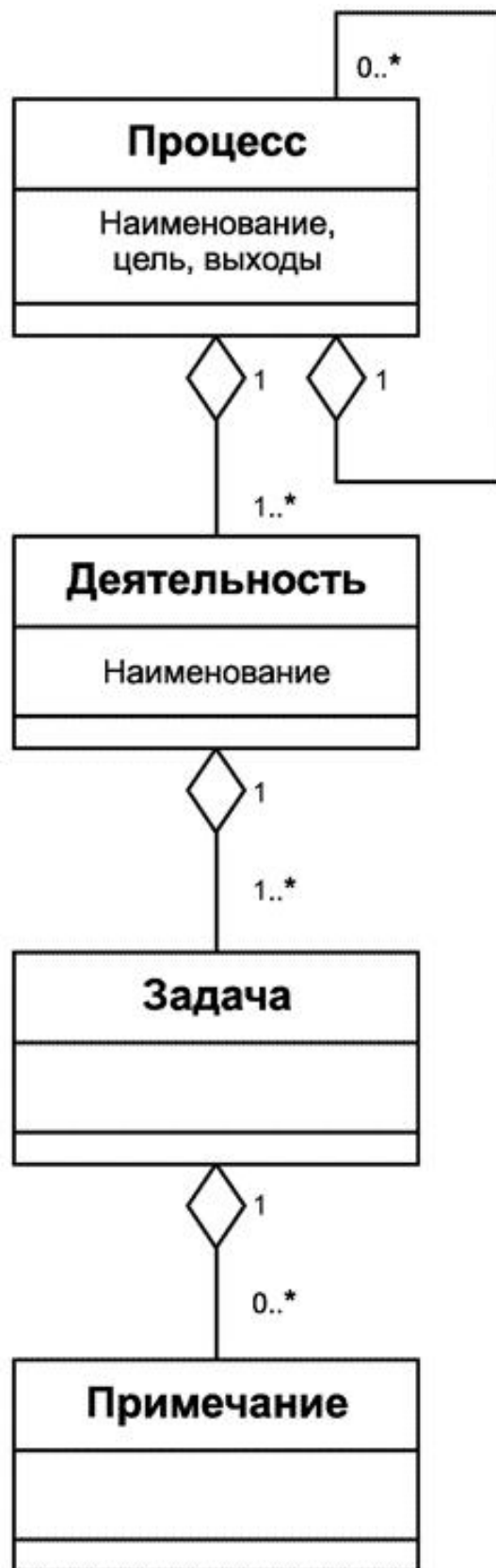
Рисунок С.1 - Конструкции процессов в ИСО/МЭК 12207 и ИСО/МЭК 15288

Примечания используются, если появляется необходимость в поясняющей информации для лучшего описания содержания или структуры процесса. Примечания обеспечивают понимание, относящееся к реализации или области применимости, такой как списки, примеры и другие представления