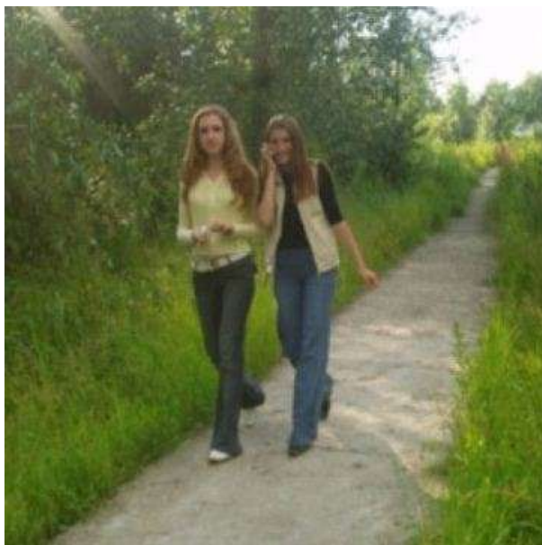
Рис. 7. Участок местности, где произошло изнасилование