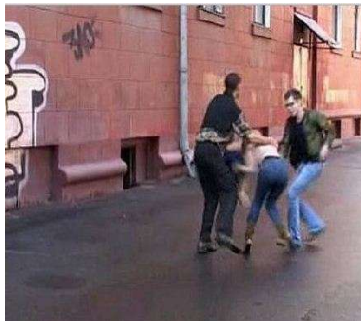
Рис. 10. Групповое нападение на девушку