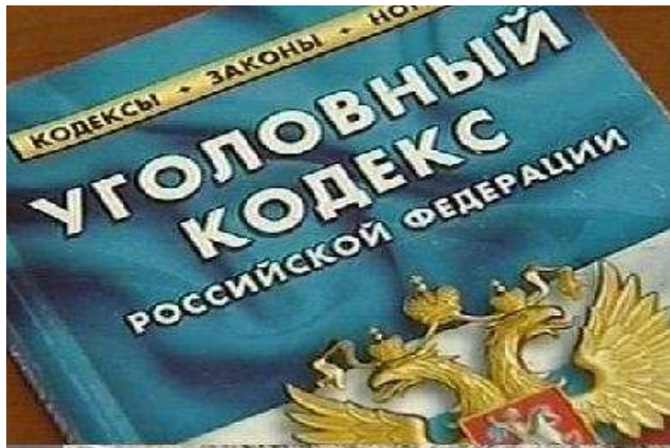
Рис. 5. Уголовный кодекс РФ

Основанием для возбуждения уголовного дела является наличие признаков изнасилования [2] (рис. 6)