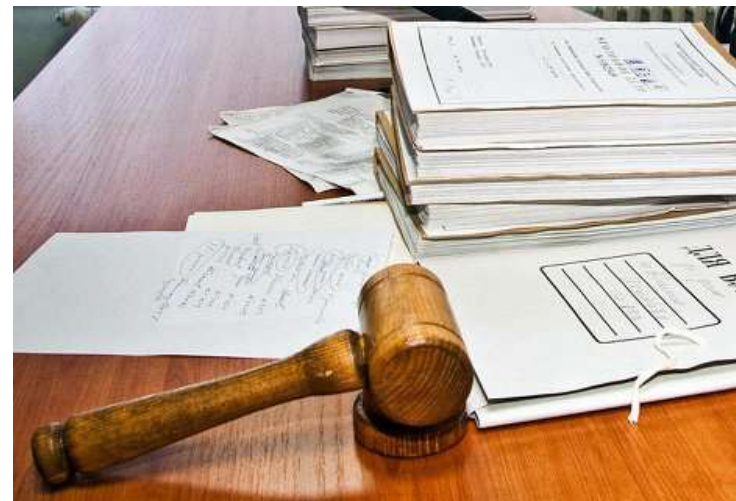
Рис. 6. Возбуждение уголовного дела