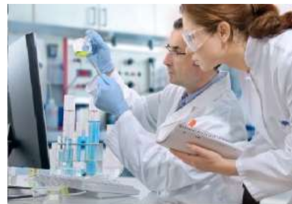
Рис. 4. Исследование спермы, обнаруженной на одежде потерпевшей