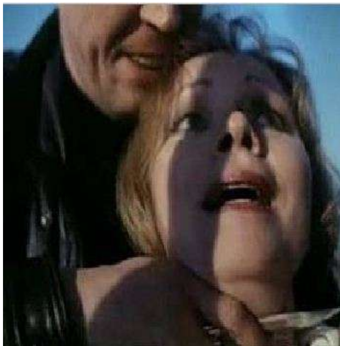
Рис. 9. Применение насилия путем угрозы ножом

3) существуют ли отягчающие вину обстоятельства (наличие угроз убийством или причинением тяжкого телесного повреждения, наличие особо тяжких последствий, повторность изнасилования) (рис. 9, 10).