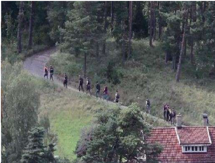
Рис. 12. Прочесывание местности