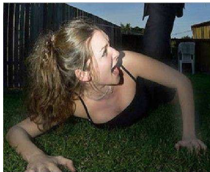
Рис. 8. Применения насилия путем нанесения ударов