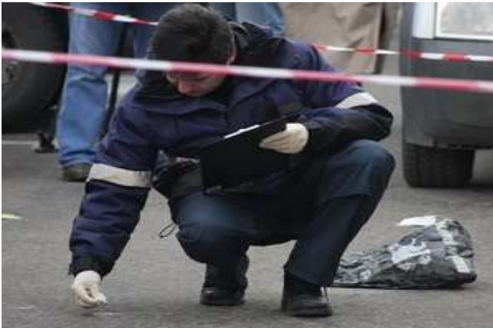
Первоначальный этап расследования преступления