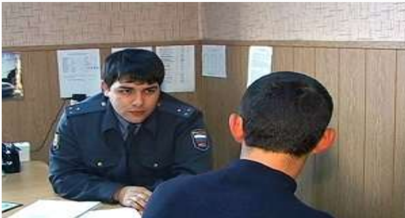
Первоначальный этап расследования преступления