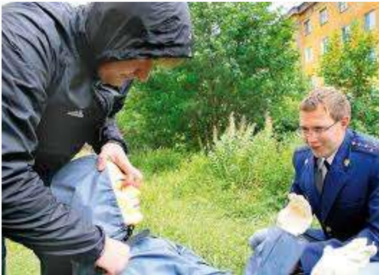
Последующий этап расследования преступлений