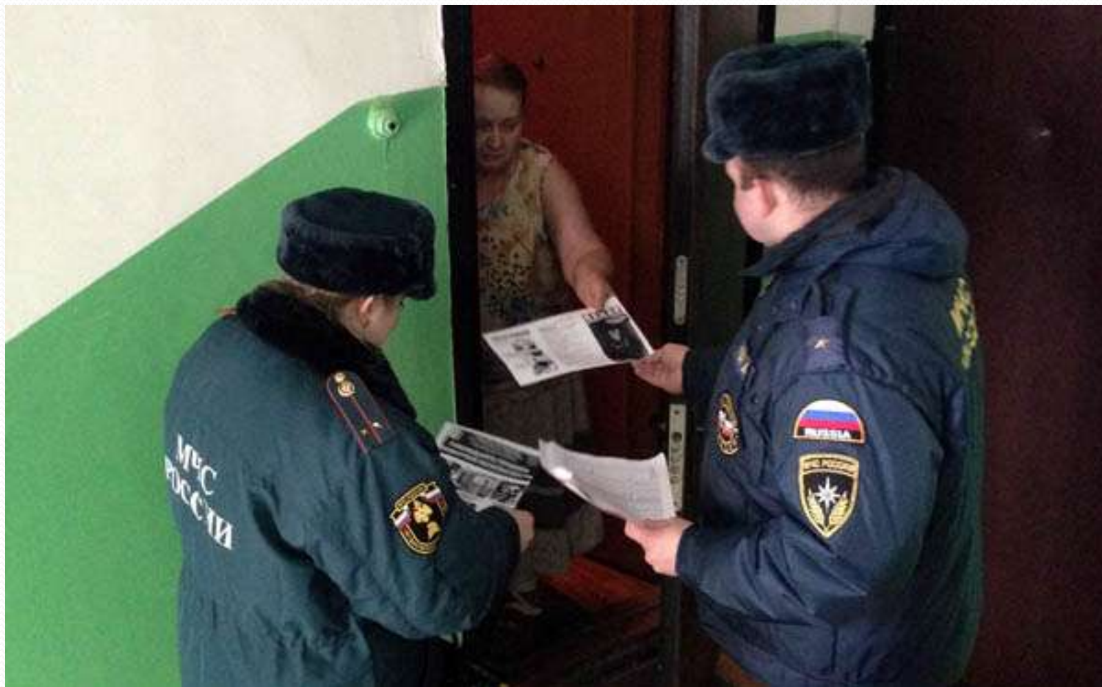
Первоначальный этап расследования преступлений