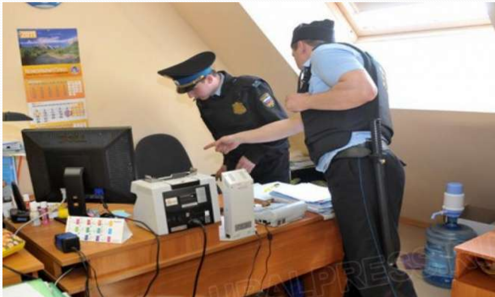
Первоначальный этап расследования преступления