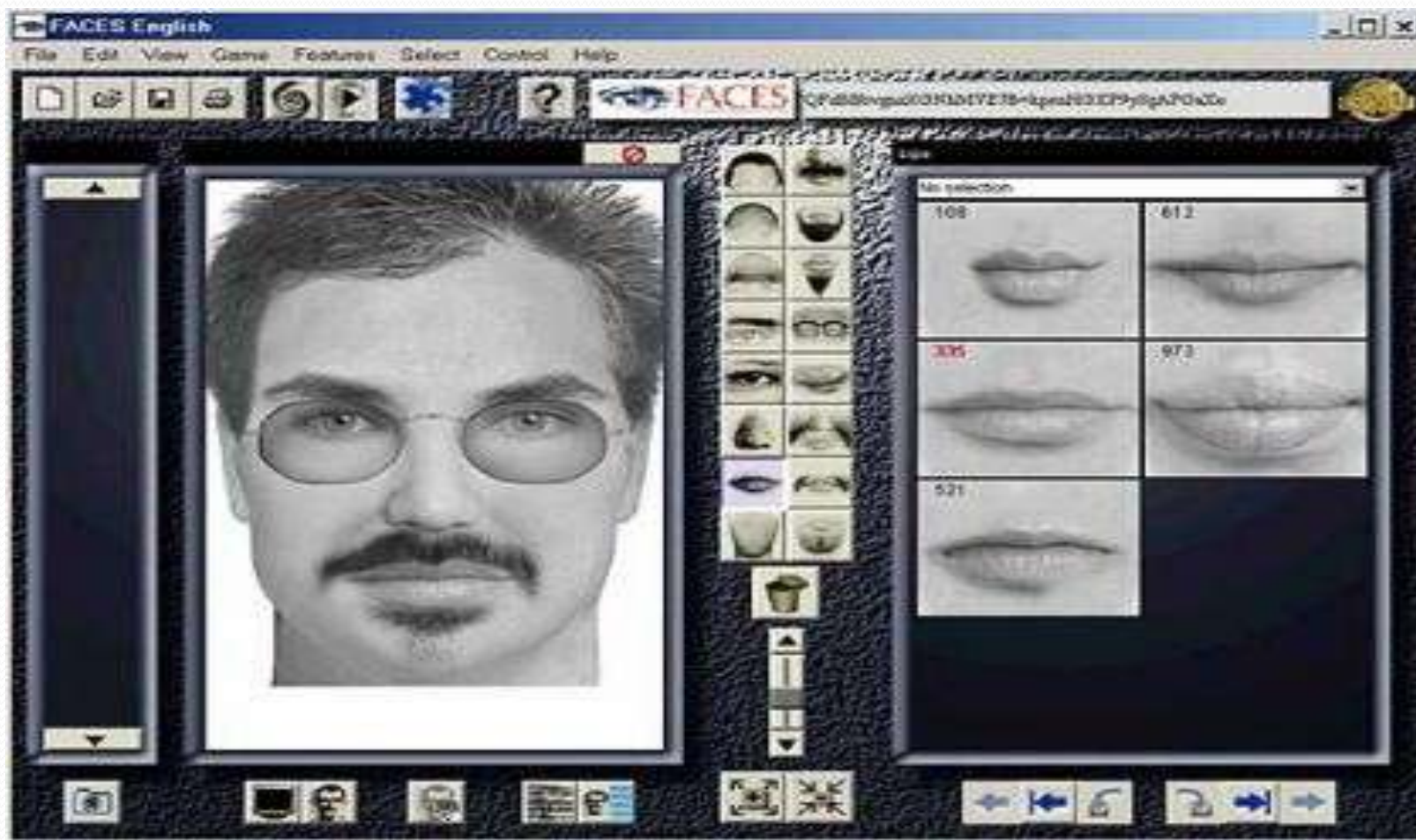
Первоначальный этап расследования преступления