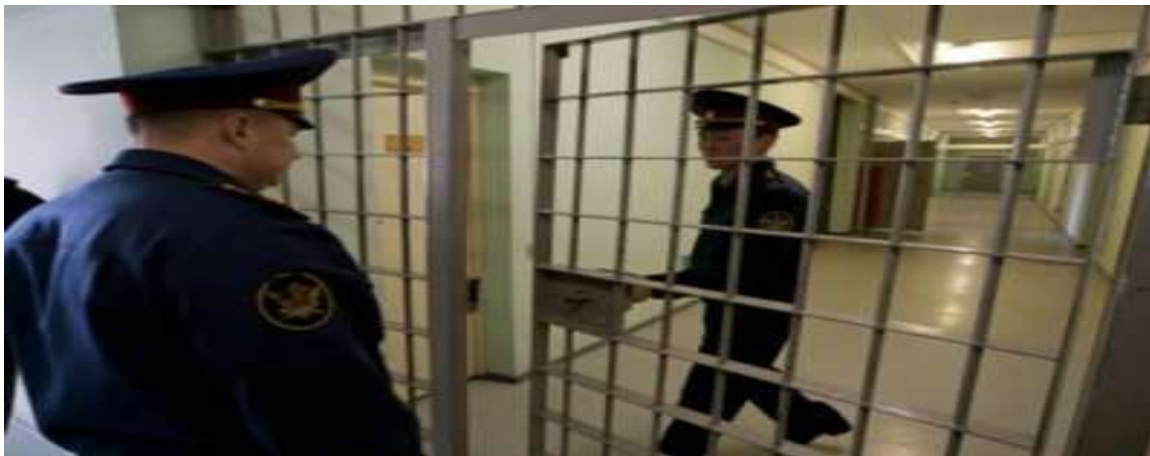
К подготовительным действиям относятся: