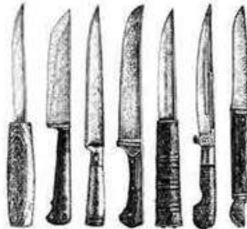
Ножи, предъявленные для опознания