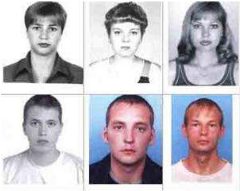
Фотографии лиц, предъявленных для опознания

Это следственное действие проводится во всех случаях, когда потерпевший или очевидцы могут опознать подозреваемого.