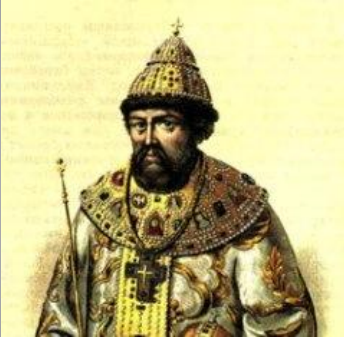
Алексей Романов 1645-1676 гг.