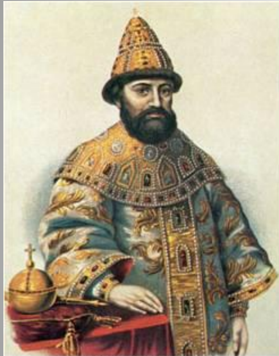
Михаил Федорович (1596-1645)