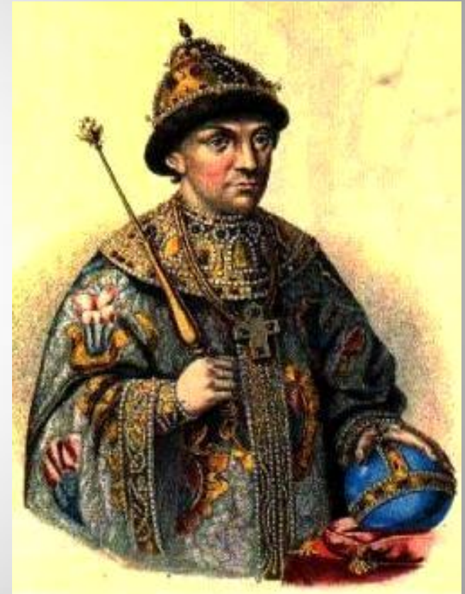
Федор Романов 1676-1682