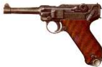
Рис. 9, 10. Пистолет Макарова и Парабеллум