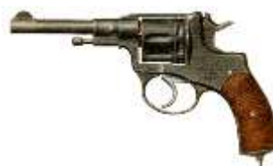
Рис. 13, 14. Винтовка и револьвер " Наган "