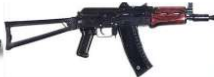
Рис. 3, 4. Автоматы Калашникова АКМ и АК74У