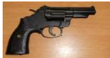
Рис. 7, 8. Пистолеты, изъятые у подозреваемого