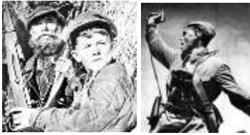
Рис. 1, 2. Огнестрельное оружие, используемое в период Октябрьской революции, винтовки и пистолет ТТ