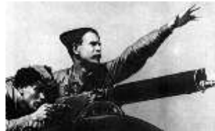
Рис. 5, 6. Пистолет " Маузер " и пулемет " Максим "