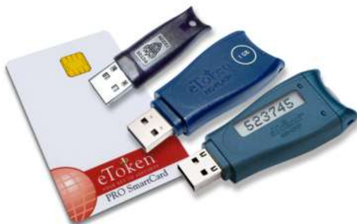
Рис. 1. Электронный идентификатор Rutoken и eToken